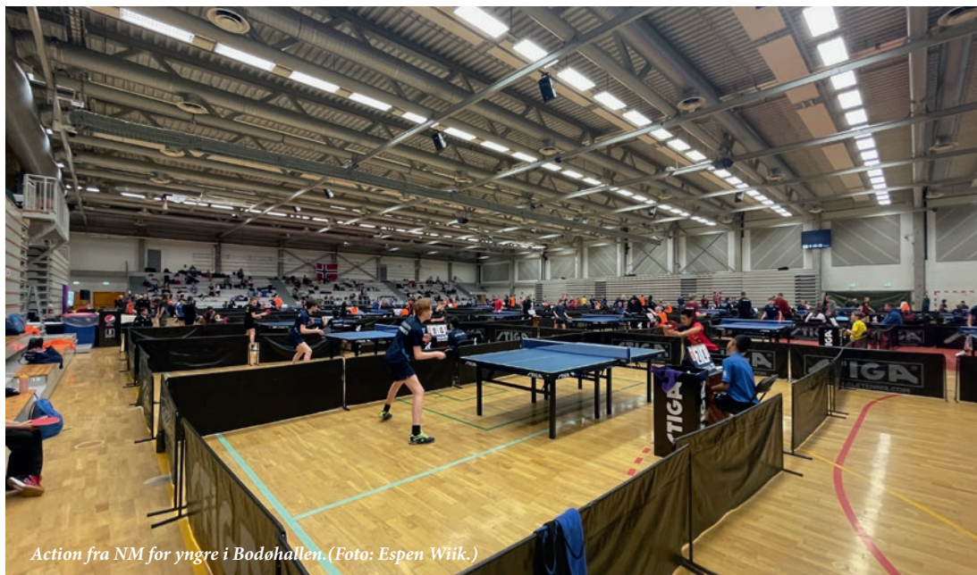
Action fra NM for yngre i Bodøhallen.

Bodø Bordtennisklubb kan ikke gi lån eller stille garantier for lån hvis ikke lånet eller garantien er sikret med betryggende pant eller annen betryggende sikkerhet. Sikkerheten for lån og garantier skal opplyses i note til årsoppgjøret.