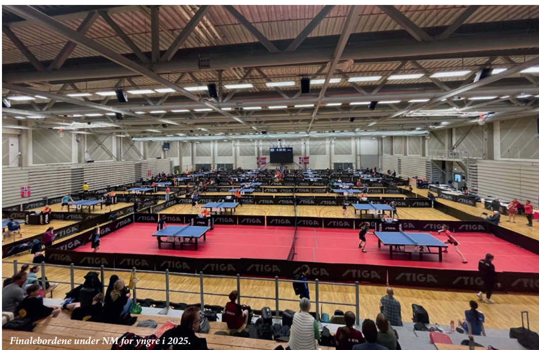
Finalebordene under NM for yngre i 2025.