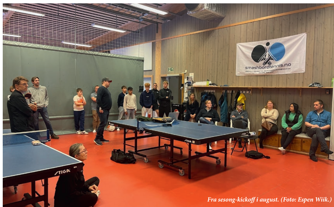
Fra sesong-kickoff i august.

Vårt 2. divisjonslag åpnet sesongen med to uavgjorte og et knepent tap. På laget spilte Yngve, Vegard, Andrei-Alin Tala og Henrik. Vårt 3. divisjonslag med Sondre, Fredrik og Mathias hadde sin beste kamp da de slo Tromsø 3.