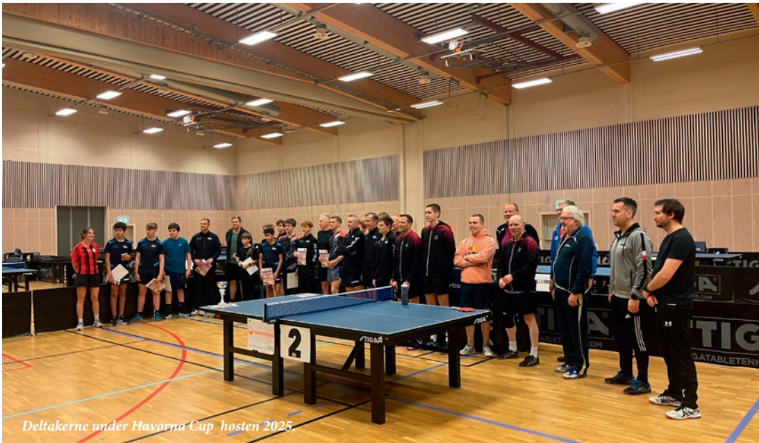
Deltakerne under Havorna Cup høsten 2025.