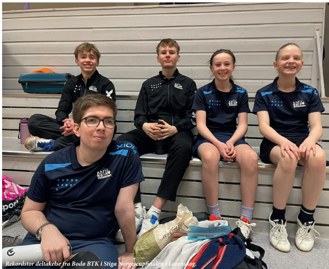
Rekordstor deltakelse fra Bodø BTK i Stiga Norgescupfinalen i Lorenskog.