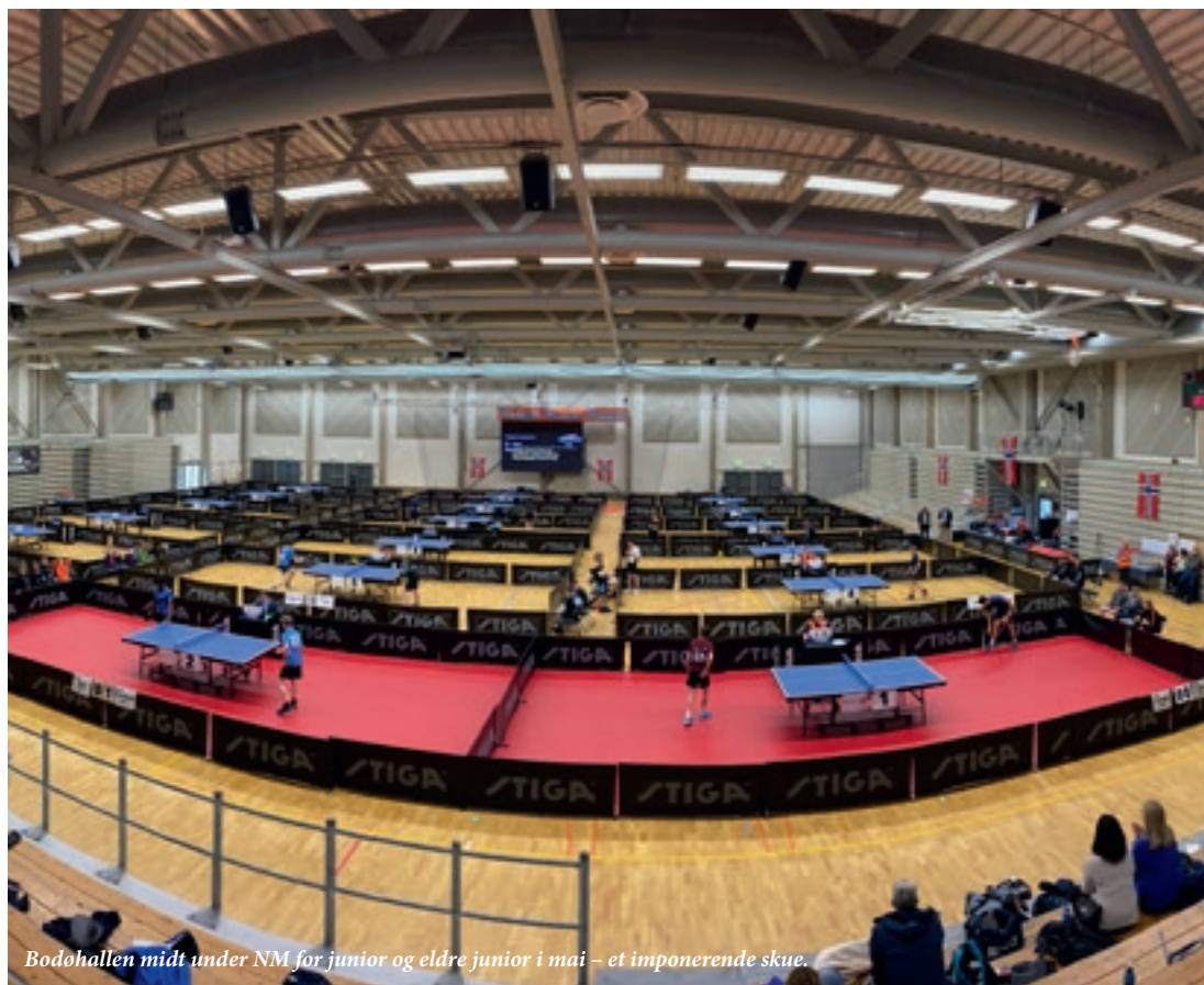
Bodohallen midt under NM for junior og eldre junior i mai – et imponerende skue.