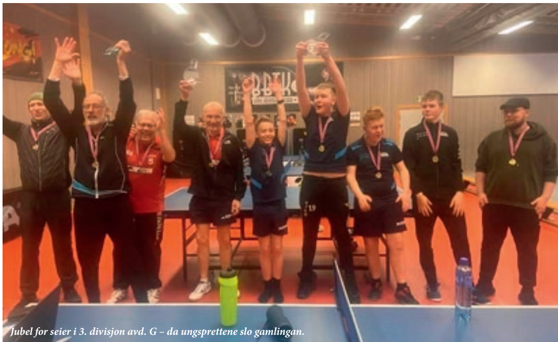
Jubel for seier i 3. divisjon avd. G – da ungsprettene slo gamlingen.

18.–19. mars, samlerunde 3. divisjon avd. G, Bodø. Andre samlerunde. Bodø BTK stilte med tre lag.