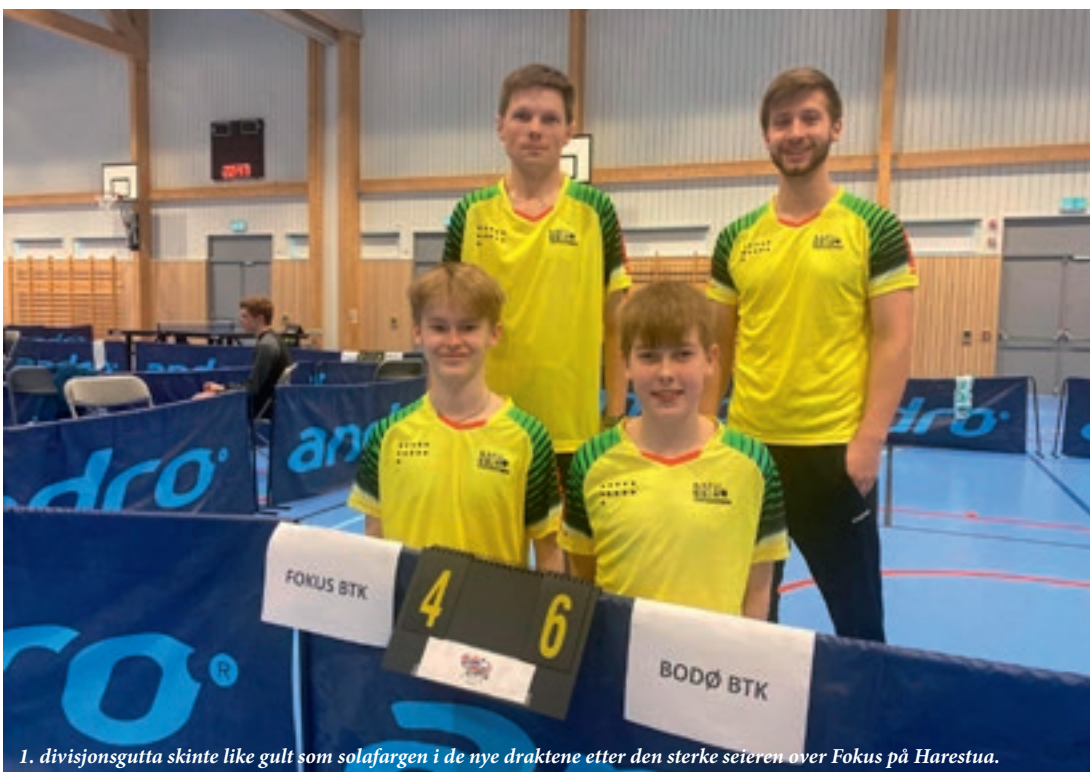
1. divisjonsgutta skinte like gult som solafargen i de nye draktene etter den sterke seieren over Fokus på Harestua.