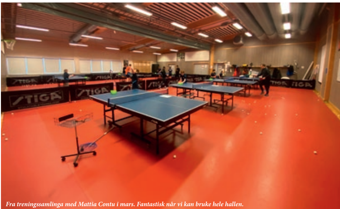
Fra treningsamlinga med Mattia Contu i mars. Fantastisk når vi kan bruke hele hallen.