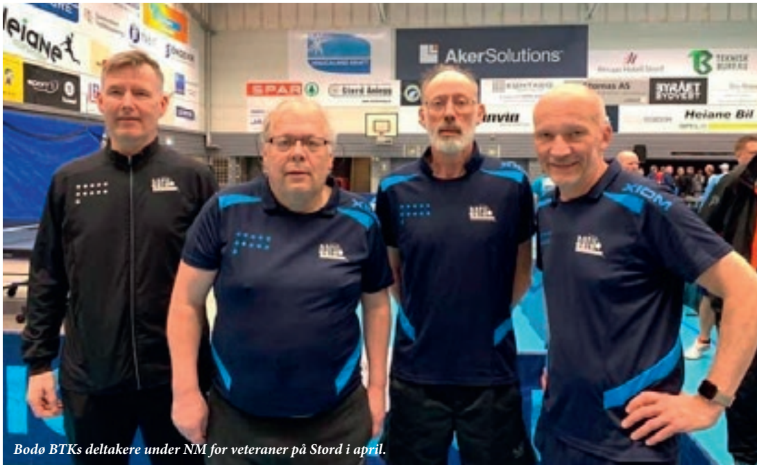
Bodø BTKs deltakere under NM for veteraner på Stord i april.