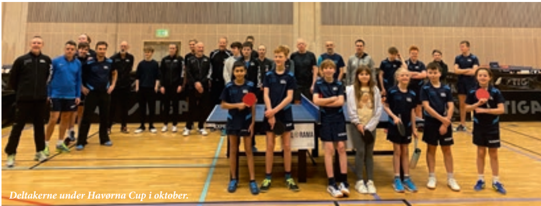
Deltakerne under Havørna Cup i oktober.