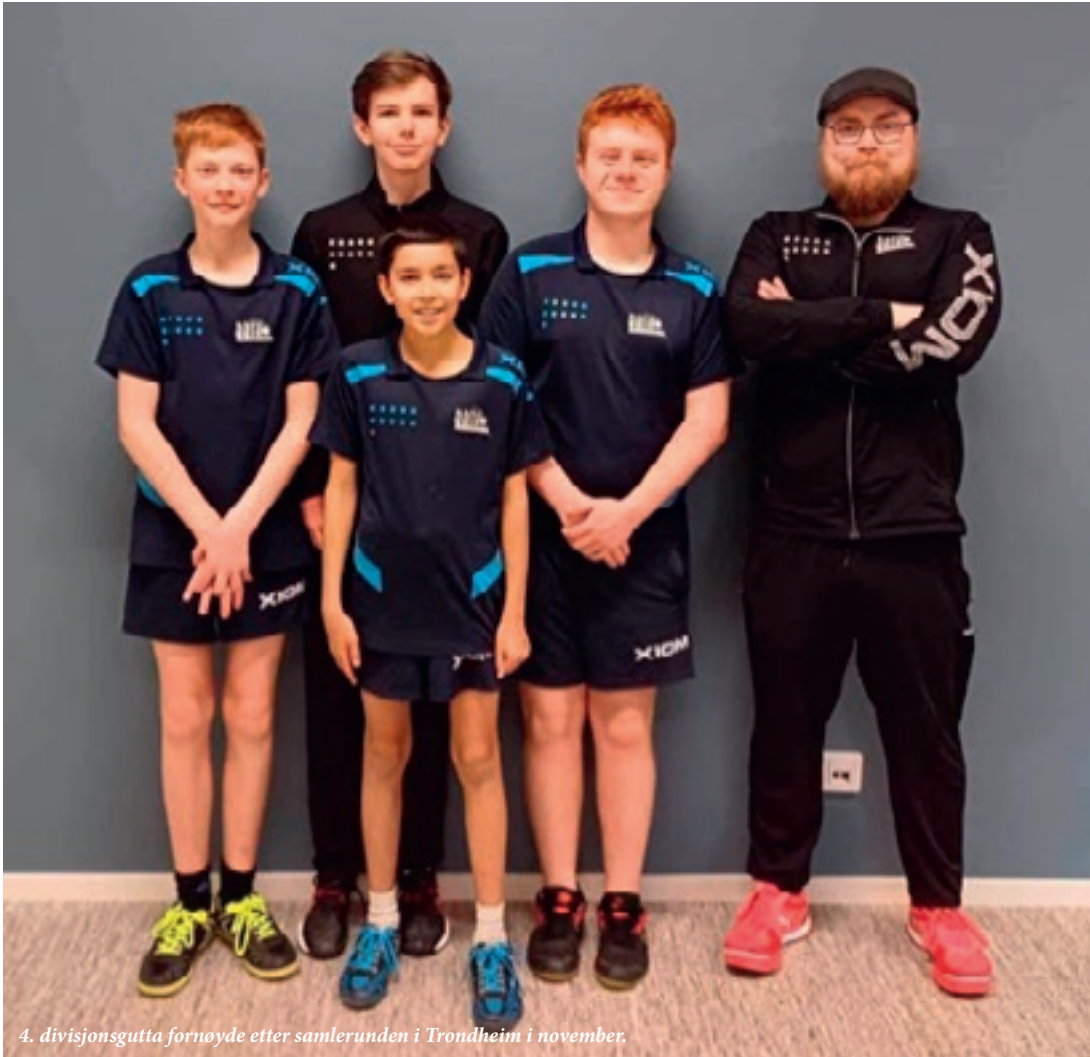
4. divisjonsgutta fornøyde etter samlerunden i Trondheim i november.