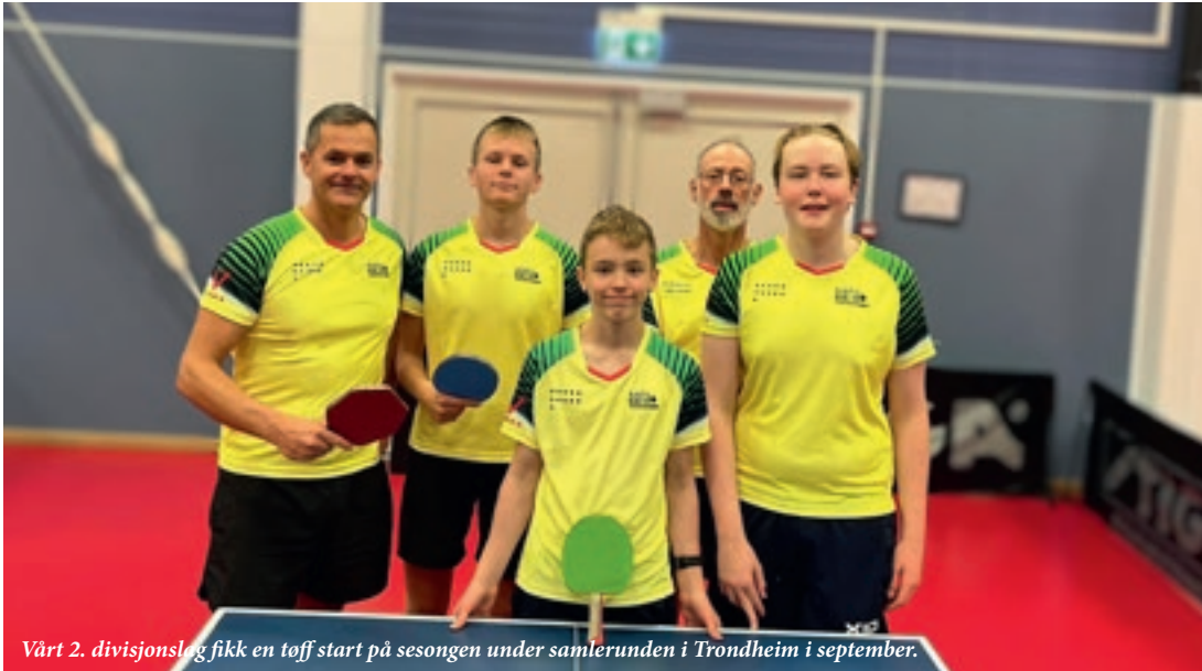
Vårt 2. divisjonslag fikk en tøff start på sesongen under samlerunden i Trondheim i september.