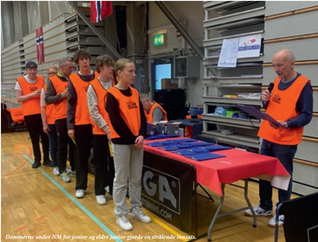
Dommerne under NM for junior og eldre junior gjorde en strålende innsats.